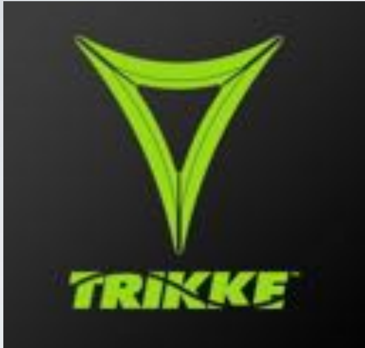
EVs Street Store